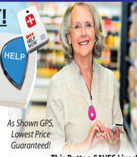
This Button SAVES Lives!